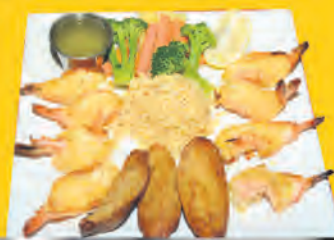
TABLE D'HÔTE 7 JOURS SEMAINE